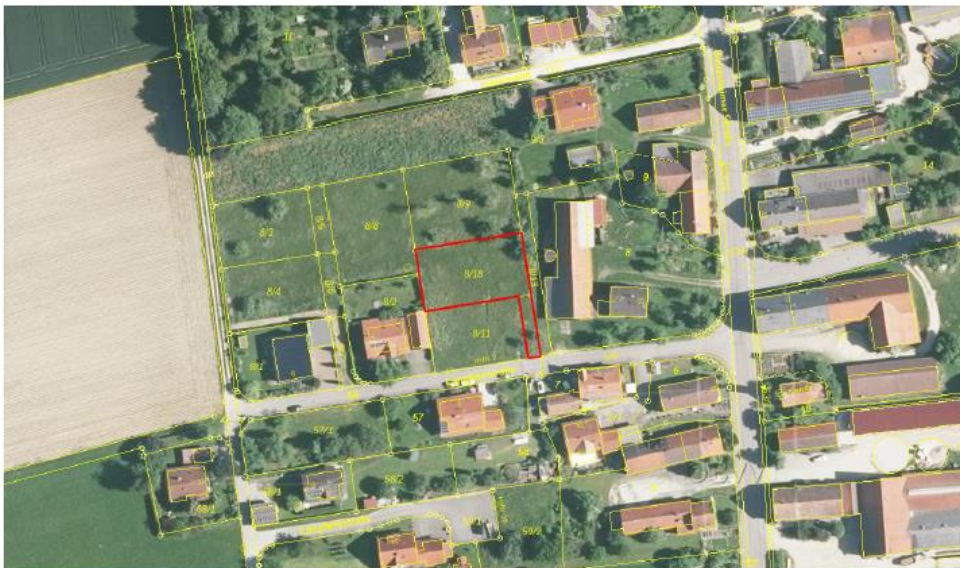
Abbildung 1: Plangebiet (rot), (© 2024 Bayerische Vermessungsverwaltung)

Im Norden wird das Gebiet von Wiesenfläche, im Westen von Bebauung und Gartenflächen und im Osten durch einen Hof mit Bebauung begrenzt. Im Süden (Fl.Nr. 8/11) entsteht aktuell ein Einfamilienhaus mit Gartenfläche, welches noch nicht im Luftbild bzw. Kataster verzeichnet ist.